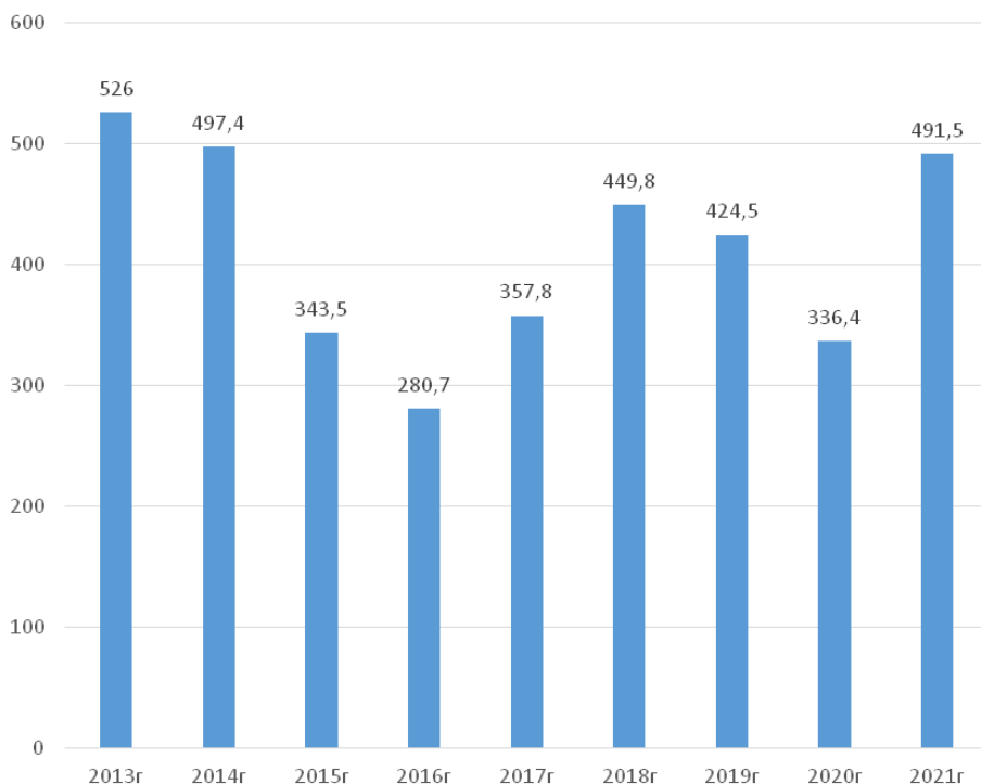
Рисунок 1. Динамика показателей экспорта продукции из России зарубеж, млрд. долл.