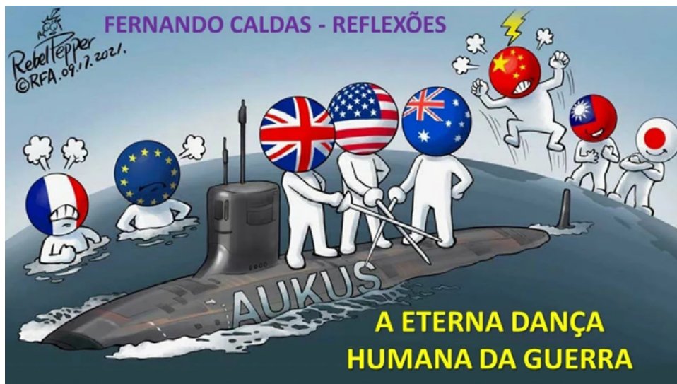
Рисунок 2. Карикатура на AUKUS

ДНЯО обязывает ядерные государства не передавать данное оружие и контроль над ним неядерным странам, а также не помогать им в его производстве или приобретении (не запрещает размещение ОМП на территории государств, не обладающих им), неядерных участников – не производить ядерное оружие и не добиваться помощи для его создания или приобретения. Проверка выполнения обязательств возлагается на Международное агентство по атомной энергии (МАГАТЭ).