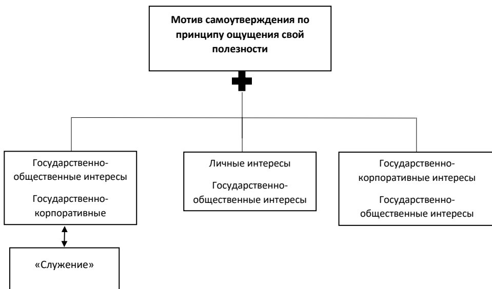
Рисунок 3. Схема распределения приоритетов в интересах пассионария

В своем исследовании авторы соотнесли понятие «пассионарность» и группы приоритетов в интересах во власти, выявили категории и охарактеризовали их отличительные особенности.