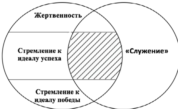
Рисунок 2. Соотношение принципа служения и мотива самоутверждения по принципу ощущения своей полезности в условиях стремления к идеалу успеха

Указанные выше приоритеты в интересах не могут присутствовать в сознании человека отдельно, в отрыве друг от друга, они обязательно будут сочетаться друг с другом в совокупности.