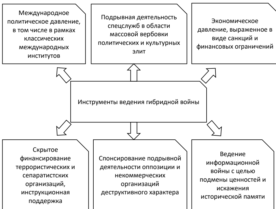
Рисунок 1. Инструменты ведения гибридной войны

Каждый из представленных инструментов обладает своими уникальными особенностями и конъюнктурой применения. Достижение успеха в гибридной войне требует использования всего набора инструментов воздействия путем комбинирования интенсивности их применения в зависимости от текущей геополитической конъюнктуры. К примеру, использование финансово-экономических санкций и технологических ограничений требует под собой веских международных оснований, которые необходимо создать даже путем подмены фактов [8. С. 177]. Кроме того, при разработке санкций необходимо учитывать