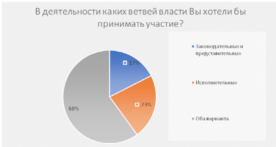
Рисунок 2. Ветви власти, предпочтительные для партисипативного участия

Мы видим, что подавляющее большинство граждан – около 60% – желают принимать участие в работе двух ветвей власти, тогда как за участие в работе исключительно исполнительных органов выступает 23% респондентов, а законодательных – 17%. Респонденты мотивируют выбор одновременно двух ветвей власти такими категориями, как «Патриотизм», «Необходимость всестороннего контроля власти», «Наличие идей и предложений», «Гражданский активизм», «Интерес». В тоже время, около 35% респондентов не смогли раскрыть своих мотивов такого выбора. Исходя из этого, можно предположить, что в случае этих граждан, мотивы заключались в плоскости категорий «Интерес» и «Самореализация», которые вызвали гипотетическую возможность участия в работе двух ветвей власти. Респонденты, выбравшие участие в работе только исполнительных органов власти, обосновывали свой выбор «Работой с реальными практиками государственного управления», «Ценностью работы на местах» и «Большей маневренностью исполнительных органов власти». Респонденты, выбравшие участие в работе только законодательных органов власти, обосновывали свой выбор «Необходимостью демократического развития», «Значимостью законодательных органов», «Политическим весом принимаемых решений».