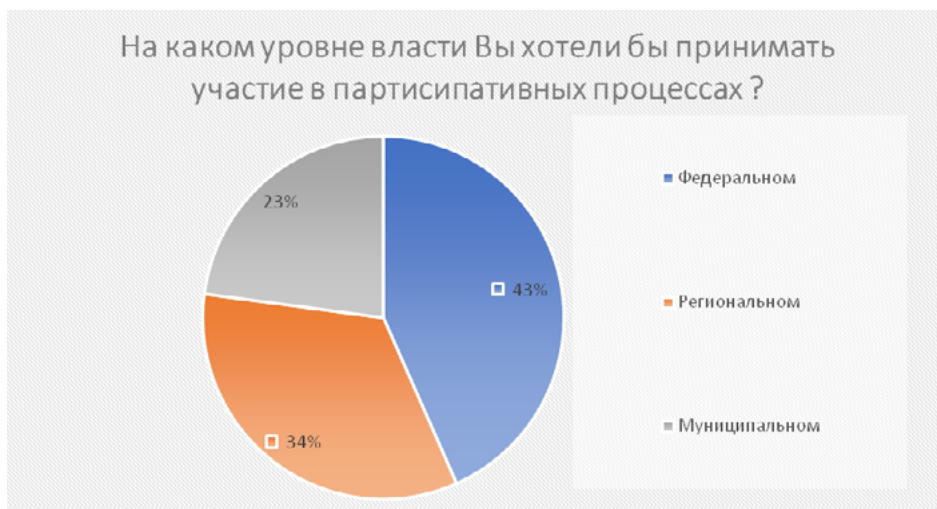
Рисунок 3. Уровни власти, предпочтительные для партисипативного участия

На Рисунке 3 мы видим, что большинство респондентов – 43% желают вовлекаться в работу федеральных органов власти, тогда как на региональном и муниципальном уровне готовы вовлекаться 34% и 23% соответственно. Интересно, что с каждым понижением уровня власти, количество респондентов, готовых принимать участие в его работе понижается на около 10% (+/- 1%). Кроме того, около 37,2% респондентов изъявили желание вовлекаться в работу власти на всех ее уровнях. Граждане мотивировали это категориями «Общественная польза», «Необходимость контроля на всех уровнях власти», «Необходимость реализации жизненного опыта», «Наличие идей и предложений». В тоже время, респонденты, выбравшие только федеральный уровень власти, мотивировали свое решение «Большим масштабом принимаемых решений и их значимостью», кроме того, присутствует мнение, что «Важные решения принимаются только на федеральном уровне». Мотивация респондентов, выбравших региональный уровень участия, заключалась в «Наличии опыта» и «Знании региона». Мотивация респондентов, выбравших муниципальный уровень участия, заключалась в таких категориях, как «Польза малой родине» и «Отсутствие опыта».